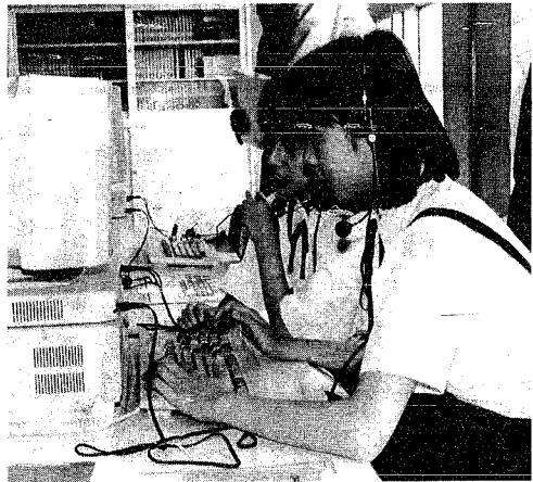
キーをたたき、画面を見る表情も真剣そのものです