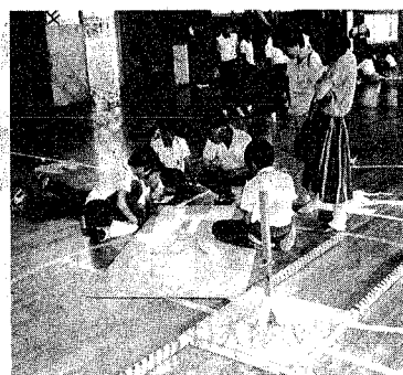
こちらのグループでは馬のみこしを製作中