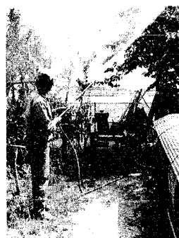
手押型動力噴霧機で薬剤散布