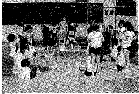
北部総合コミュニティセンターは年間15万人の人が利用しています(同センター親子体操教室)