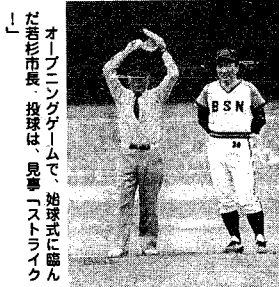
オープンリーグゲームで、始球式に臨んだ若杉市長。投球は、見事「ストライク」