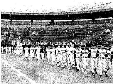
ブラカートを先頭に、812チームの代表が整然と入場行進。家族ぐるみの参加もあり、和気あいあいの雰囲気にあふれていました。