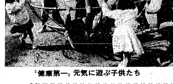
健康第一、元気に遊ぶ子供たち

納入通知書を受けた日から三十日以内に六十一年中の所得が分かる資料（所得税・住民税の申告書の控え、源泉徴収票など）、印鑑、納入通知書を持参のうえ、国民健康保険課においで下さい。国民健康保険課（本庁舎五階、内線三八八三、八九番）へ