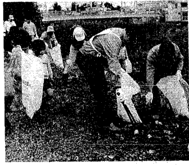
雪に隠れていた空き缶、紙くずが目立ちます

今年も三年続きの大奮闘で、雪消えとともに、今まで雪で散らかっていた空き缶や紙くずなどを散れが目につき、大通りではほりが舞う季節となりました。 市では、現在、公園や海岸線など汚れたのび場所をパトロールし、一斉清掃の準備をするなど、春先きのクリーン作戦を展開しています。 特に、西海岸や鳥屋野島の周辺道路や道路際の緑地帯に多くの放棄されたごみが目立っています。市民の皆さんも、一人ひとりが「汚さない、捨てない、きれいに」の意識を持ち、きれいなまちづくりにご協力下さい。