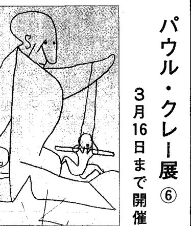
「いたずら」1940年作、素描

3月16日まで開催 今回のクレイ展は、これまで紹介されることの少なかった晩年の素描が多く展示されています。亡命時代のクレイは素描を想像力の條條と考へ、一日として線を引かぬ日はなかったといひます。子供の絵を思わせる大胆な線の描きかたが、不思議な透視と見せる者の心をつかむられること、人間社会や個人の肉奥に潜む醜さ、愚かさ、こつこつとさまざまをも見据えよとしていたからでしょうか。 自分か描つていたはずの人物の悪さに手を焼く氣の毒な男、私たちが自身の人生の戯曲でないか、はたして言い切れるでしょうか。 (市美術館 観覧料 一般七百円、大・高生五百円、小・中学生三百円、開館時間 午前九時～午後四時、休館日 月曜日)