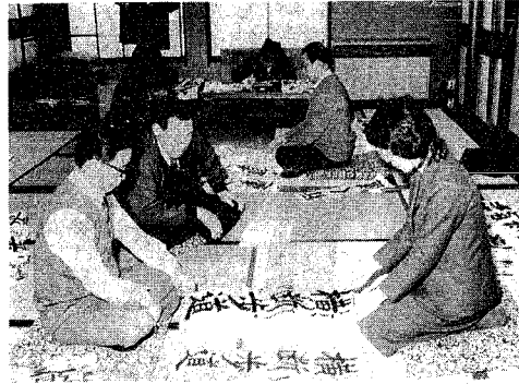
9,717点もの力作が寄せられました(今年の審査風景)

市内の小・中学生から募集した「交通安全全書初め」の審査が一月二十四日に行われ、九千七百十一点の応募作品の中から各学級ごとに特選一点、金賞三点、銀賞五点、銅賞、佳作、合わせて七百十四点が決められました。 この審査は、交通安全思想の普及に役立つと、市が毎年行っているもので、今年で十二回目。 課題は今年から変わり、小学生は「一年生から五年生順に（くるま）（しんごう）（人通り）（行く道）（石佛通り）（横断歩道）（中学生の課題品）の中から各学級ごとに特選一点、金賞三点、銀賞五点、銅賞、佳作、合わせて七百十四点が決められました。 審査を終えて、浜矢先生は「これは年々高くなっていく。全体的に悪くもよくもなっている」と、講評を述べました。