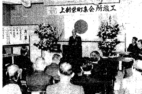
若杉市長もお祝いに駆けつけ、喜びを分かち合いました

ふれあいと連帯のある「コミュニティづくり」 ●二月二日午前八時十五分～八時半 ●BSNテレビ「こんには新潟」