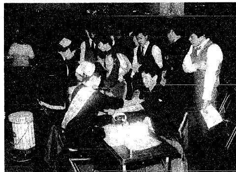
20歳の記念に献血をしましょう

鳥屋野地区公民館会場催し物 町民スキーツのつどい 日時 1月19日午前8時出発、午後5時 半帰着 行き先 六日町ミナスキ場 定員 先着45人 参加費 大人2,500円、小人2,300円 その他 初心者および希望者には講習も あり 申し込み 参加費持参で会場へ 鳥新君子供百人一首大会 日時 1月26日午前10時～正午 対象 小学3年生以上40人(先着順) 参加費 100円(おしるこ代) 申し込み 電話で会場(045-2371)へ 鳥婦人セミナー「家族を考える」 日時 1月21日～2月18日毎週火曜日午 前10時～正午(4回) 定員 婦人40人(保育室あり) 申し込み 電話で会場へ 新南海の仏像～仏像彫 日時 1月24日～3月 前10時～正午 会場 仏像鑑賞、新漸 板碑と石仏めぐり 申し込み 1月18日ま まで、電話番号を明記し 円切手をはる)同封し 和113-30)へ 女性セミナー 『今、あなたは』 日時 1月23日～2月6 会場 西地区公民館 テーマ 老いと女性性 定員 40人 申し込み 1月18日まで 01-031)へ