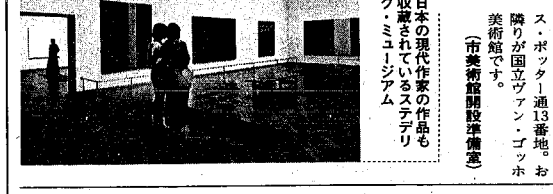
アムステルダム市立美術館

「アムステルダム市立美術館とは…」 施設としては常設・企画展示室、収蔵庫のほか、五万冊の図書、一万部の図録、一七〇種の現代美術の定期刊行物を備え、自由に閲覧できる図書室、二五〇