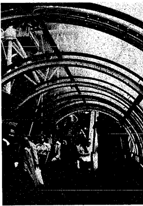
あたたか下水道の中を通るかのようなポントラー文化センターの通路