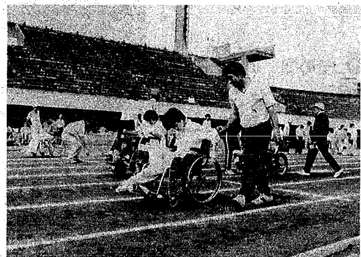
「やさしさを行動に」をテーマに開かれた障害者大運動会 (9月30日・市陸上競技場で)

陸上競技場の改修は、市役所の移転先が県庁跡地に變更されたことに伴い、今年度と来年度の二カ年かけて行われ、総事業費は五億四千万円、完成は来年八月中旬の予定で、秋のスポーツシーズンからは新しい陸上競技場で競技できることになりました。 全国に六十ほどある第一種陸上競技場のうち、全天候型でないのは新潟を含め三カ所、改修が終わると、全国レベルの施設となり、記録の向上が期待されます。 また、雨が降ったあとに整備やメンテナンスの手間も省け管理も容易になります。 今回、全天候型に改修されるのは、競技場のトラックとフィールド、競技場に隣接するサブトラックの一部と雨除けトラックです。 競技場では、一周四百メートルトラックより投げやり走り高跳びなどを行います。 また、サブトラックも新たに