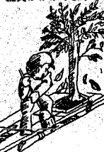
側溝の清掃も重要な役割を担っています

のをよく見かけますが、雨が降ると、これらの異物は下水管に流れ込み、管や雨水ますが詰まる大きな原因となります。この結果、側溝の水があふれ、道路や宅地が水浸しになります。 市では、下水管にたまった異物の排除や破損箇所の修理、ますの清掃や成積などを行っています。市内には下水管が延べ約三百十、マンホール約一万個、雨水ます、汚水ます約四万五千個もあり、膨大な経費と人手がかかっています。 したがって、出来るだけ施設に負担がからないように、ごみなどの異物を側溝などに捨てないようにお願いします。 また、自宅前の側溝やますなどの清掃についても、ぜひご協力をお願いします。