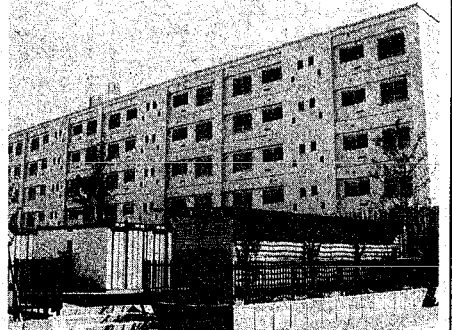
ほぼ完成し、あとは入居者を待つだけとなった藤見町団地 C 棟

今年二月から建設を進めていた市営住宅「藤見町団地 C 棟」(東山の小学校付近)が、まもなく完成します。入居予定日は十二月一日ですが、募集住宅、鉄筋コンクリート造り五階建てで、第一種住宅に準じ、明日、十九日