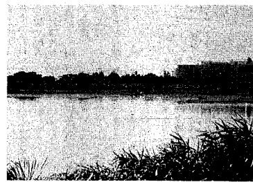
まもなく白鳥の姿が見られる鳥屋野湯

常に働きません。維持管理には専門的な知識や技能経験が必要とされています。調査では、公共下水道を使用している世帯を除いて、調査によれば、し尿浄化槽の維持管理を専門業者に委託している人は九七・六%。非常に高くなっています。しかし、点検回数については、三カ月に一回以上の委託状況は大