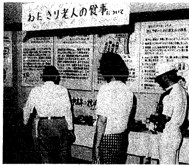
ねたきり老人の食事についての展示 (8月に開かれたふれあい新潟展'84から)

康和園では、来月 1 日から独居暮らし老人や老人世帯の方を対象に給食を提供します。日時 毎週火、金曜日午前十一時四十分～午後一時 定員 各回三人 費用 実費二百円