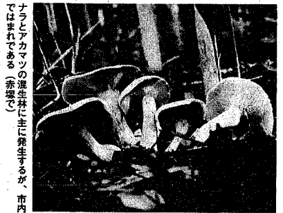
ナラとアカマツの混生林に主に発生するが、市内ではまれである(赤塚で)