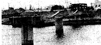
年内完成を目指し、工事が進む関屋下水道橋

十七日には、白山排水区のうへ処理開始された自治町内会を対象に、白山下水道橋、中部下水処理場の見学や下水道に関する意見交換が行われ、市では今年度、五十億九千万円を公共下水道事業に投入し、処理区域の拡大を図ります。 中部処理区の整備では、関屋排水場、関屋下水橋上