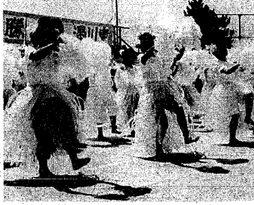
お母さんたちも大奮闘した、応援合戦