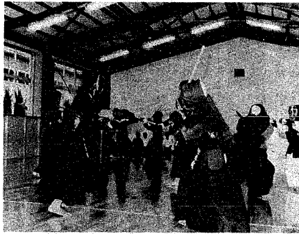
さっそく剣道の初練習 (木戸中学校武道場で)

市では、屋内体育館での体育授業に支障の出ているマンモス中学校に、今年度から武道場を建設し、このたび木戸中学校と内野中学校に完成しました。武道場は放課後のクラブ活動にも利用され、スポーツを通じて非行防止にも役立ちます。今後、マンモス校を中心に、計画的に建設を進めます。