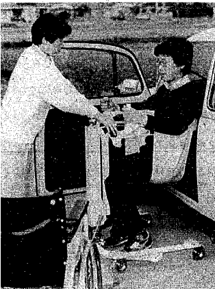
介助者1人で、楽に車イスや自動車に移せる器具