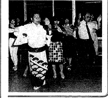
新潟市と中国黒龍江省の省

今年も、恒例の新潟まつりが来月七・八、九日の三日間、盛大に開かれます。雨の降らない時期に期日変更し、今年で二年目、まつり最大の呼び物は、三万人の踊り手が参加する大民謡流し。 民謡流しに初参加する日本交通公社の皆さんも、今、最後の仕上げに大わらわです。踊りに、よっと一杯、も控え、仕事を終えた午後七時から、練習をします。専真。 新潟まつりは、八月七、八日に民謡流し、八、九日はまつり行列、水上渡御と、九日は信濃川花火大会が行われます。