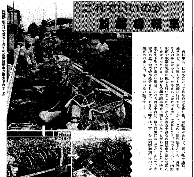
これみんな放置自転車です 衰れ、黒こげの運命に……

7・16豪雨 市では、七月十六日の豪雨で床下・床下浸水被害を受けた方々の実態調査（市職員が直接、または自治・町会長さんを通じて）を行いました。被害を受け、まだ調査の対象になっていないと思われる方は、お手数でもご連絡下さい。 連絡先 交通防災課へ り災証明は、市民課各地区事務所で行います。