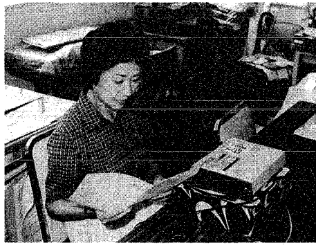
日曜日を除く毎日、テーブルに吹きこみをするボランティア

活版屋のテレホンサービスが、午前十時から十一時、ボランティアの活動を支えられてスタートします。