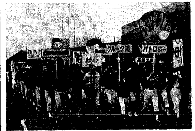
プラカードを手に堂々の入場行進をする選手団

ゆったりとした歩道 橋の計画幅員は千メートル、車道十八メートル(四車線)、自転車道片側一・五メートル、歩道は二・五メートル片側二・五メートルです。