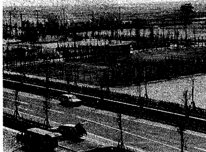
のびのびプレーできる流通公園テニスコート

新潟流通センター(坂井特地区)に、このほど流通公園が完成しました。公園内には、テニスコート四面と、ゲートボールやバレーボールなどができる運動広場がたっぷりありまます。また、寺尾中央公園にもテニスコートが完成し、これで同園分水以西の市営テニスコートは三カ所になりました。