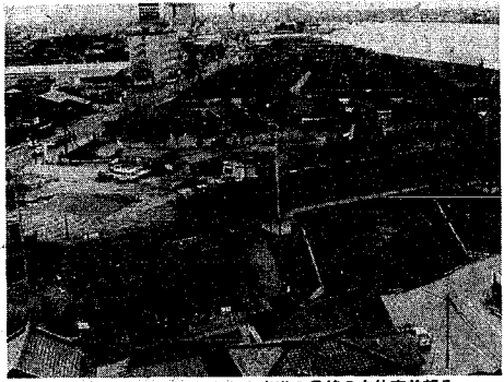
先月けた架け工事が行われた東港2号線の立体交差部分