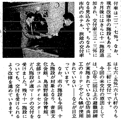
消防車の出陣風景

市消防局では、先月二十六日、防火準備を満了したパ、スパー、パブリックなど三十三施設に、適マークを交付しました。 適マーク制度は、今までの三十八以上取寄または三階以上