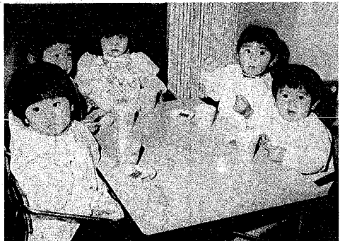
保育料を引き下げ、入園しやすいようにしました(流作場保育園で)

三歳以上児も据え置き 市では、保育園の定員割れ対策の一環として本年度から三歳未満児の保育料を引き下げます。三歳以上児についても、五十九年度保育料に据え置き、父母負担の軽減を図ります。