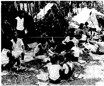
多くの市民に親しまれている三川自然の森

「青少年自然の森」の広さ約二十七万平方メートル。市利用し込みを四月一日から、三つのキャンパスを受け付けます。「山の家」も常時利用申し込みを受け付け、さらには森の中を散策できる遊歩道、展望台、散策の状況などの施設が整備されています。 「青少年三川自然の森」は、