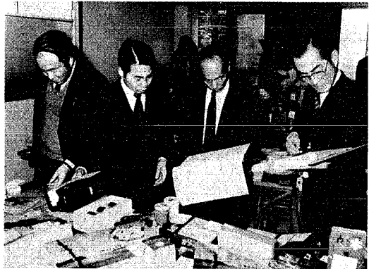
会場での審査風景。二九六点が合格しました。

「市推薦みやげ品審査会」が去る二月二十四日(西郷)の審査会は、新潟市のみやげ品を審査して、二百九十六点を推薦品として認定し、そのうち、新製品の開発、さらには販路の拡張を図り、消費者の皆さんにも安心してみやげ品を買ってもらうと、二年に一回行っているみやげ品審査会が合格したみやげ品のマニファスチンが貼られます。 今回は、前回より五社多い六十社が応募し、土産物、みそ、みそ漬、民芸品、酒など、二百五十点を出品しました。前回五十五社、二百四十九点。 審査基準は、品質が優良か、デザインが優れているか、郷土色が豊かであるか、価格が手ごろか、不当表示されていないか、食品衛生法などに違反していないかなど。新潟の味、かおり、風情などを全国各地に伝え、新潟市をPRするものにふさわしいか十五人の審査員の厳しいチェックを受け、二百九十六点が合格しました。 審査員の間からは「前回より八十九点も出品が増えたのは、過去になかった」と。上越新幹線の開通などで観光ブームなんでしょうね」との声も聞かれました。