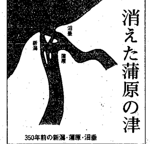
350年前の新潟・浦原・沼津