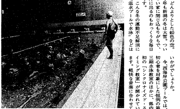
県内初のシクロナイスド、スイミング教室