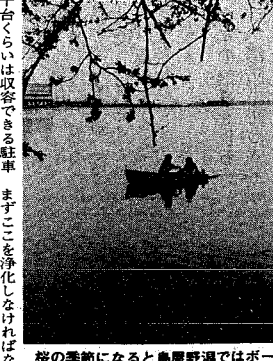
桜の季節になると鳥屋野潟ではボート遊びが始まる

（三）鳥屋野潟の浄化 鳥屋野潟の水質汚濁が深刻化しています。浄化施設を整備し、水質を改善する必要があります。