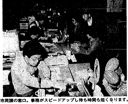
市民課の窓口。事務がスピードアップし待ち時間も短くなります。