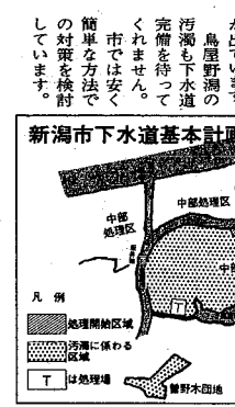
新潟市下水道基本計画

下水道と併せて幹線の整備、阿賀野川河口における処理場の建設に当たります。 これは、市では山の下部、石山の一部、新幹線、阿賀野川河口に流し流ししている市東部地域や亀田町、