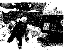
ごみステーションの除雪も忘れず