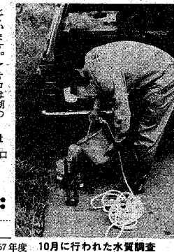
10月に行われた水質調査