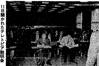
11日開かれたテレビ説明会

わが町内の道端だけでもきれいにしようと町内(葉竹山自治会二十一名)の婦人方が立ち上がり毎月一日日曜日の朝を道路清掃日として、のびのびと掃除している。市側では、鳥屋野濁周辺道路にゴミの不法投棄禁止の立札を手に配られて