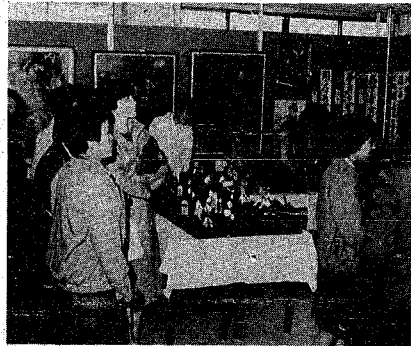
大勢の市民でにぎわったオープン記念行事

市内で一番目の地区公民館、東地区公民館の完成記念式が、十一月十日、同公民館ホールで行われた。式典には若市長ら市関係者、地元自治会関係者など約百八十人ほどが出席し、同公民館のオープンを祝いました。