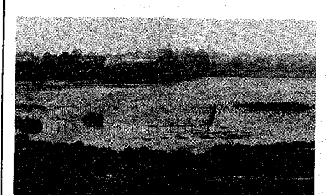
自然の宝庫「佐湯」。植物も約250種と豊富