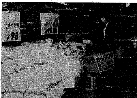
減ったというもののまだトレイ包装がチラホラ (市内スーパー食品売り場)