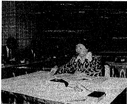
11月1日に開かれた「市民の意見を聴く会」