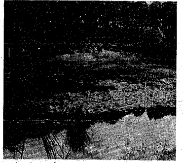
名のとおり10年前までは、食用にするジュンサイが水面を覆っていた「じゅんさい池」