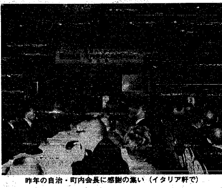
昨年の自治・町内会長に感謝の集い(イタリヤ軒で)