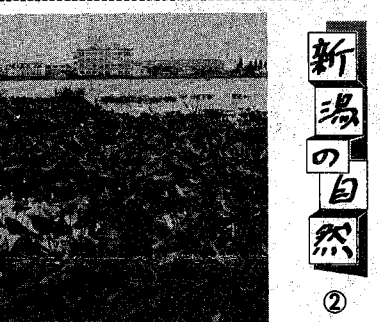
鳥屋野湯 貴重植物が激減した鳥屋野湯