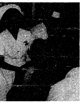
一般健康診査の受診風景