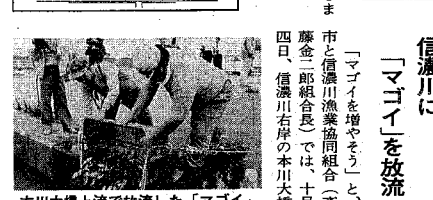
本川大橋上流で放流した「マゴイ」

東営業所は東新潟全域と横越村の一部など、八万二千世帯、二十五万五千人の料金管轄を、現在の三倍近くなり、ゆつた取り水道管の維持管理に当たります。