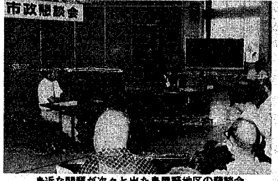
身近な問題が次々と出た鳥屋野地区の懇談会

自治・町内役員との懇談会始まる 今後12カ所で開催 「市政懇談会」は、九月三日、鳥屋野地区公民館で行われ、町内自治会役員との懇談会が始まりました。 二日、集まったのは、鳥屋野地区の自治会役員八十七人。出席した若杉市長は「市政懇談会は、五月から、婦人界と市で協力し、早期実現を希望ができました。要請していくと答えてきました。懇談会は、自由発言方式で