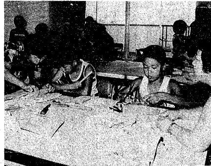
一生懸命工作づくりに励む親子(総合教育センターで)

「手づくり動くおもちゃを作ろう」と八月十八日、市立総合教育センターで親子理科工作講習会が開かれ、親と子どもが休みの工作づくりに一生懸命取り組んでいました。