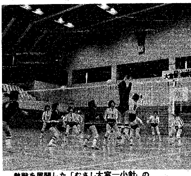
熱戦を展開した「むさし大宮一小針」のママさんバレーボールの試合