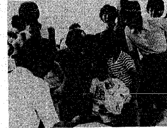
希望の品の前に長い行列をつくる子供たち

水族館 水族館で、さる十七日、日恒例となつたイモリ、ザリガニ、ヒメダカをプレゼントが行われ、夏休みを迎えた子供たちが喜びました。 「ザリガニ、イモリは一人、ヒメダカは四匹だよ。早いと午後七時半にはもう水族館に来たという子供たちは引換券を片手に希望の品の前に長い行列をつくりました。