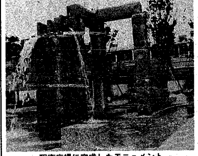
駅前広場に完成したモニュメント

新潟駅前広場のシンボルゾーンに高さ五、五メートルの石柱と滝からなるモニュメントが完成しました。 シンボルゾーンは総事業費が約七千六百万円。越後運山が約七千六百万円を経て日本海に注ぐイメージを表現したもので、作者は国際的な造形作家の関根伸夫氏。 モニュメントの石は一個六十センチ、大きいのは長さ二、九メートルある単水(くそうず)石二十三個を使用。石と石はボルトで結ばれ地震にも十分耐えるよう設計されています。 二十三個の重さは三十五トン