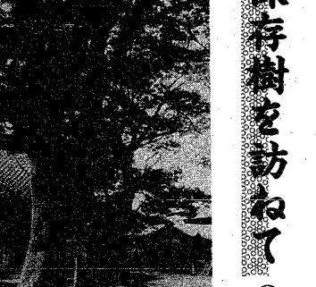
田島の八幡宮では、毎年四月十六日に祭を行い、部属の製作を折る。夏の午後になると、境内にあるけやきの下に泳みにくる人も多い。