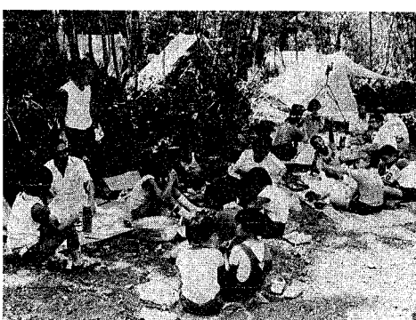
キャンプをする子供たち(青少年三川自然の森)

今年、冒険の沢、林間広場、展望台が整備された。またキャンプ場へ乗り入れバスが運行される予定です。ご利用下さい。