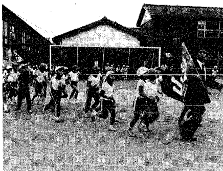
地震発生と同時にグラウンドへ避難する桃山小の児童

「新潟地震の教訓を忘れるな」と新潟地震から十九年目を迎える六月十六日、桃山町一帯で、地震体験や学校の児童などが参加して、大がかりな「防災訓練」が行われ、災害に対する備えを新たにしました。